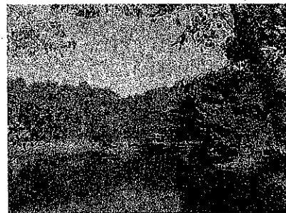
夏 無 沼

参加費 2,500円 チケット スーパーみやげ 諸根呉服店 あたたら商工会 (本所 東和・岩代 取扱所 の各振興センター) 東和観光協会事務局(東和支所地域振興課)