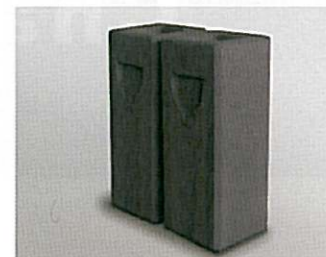
■ 大学と連携しながら開発を進めているエココンクリート製品。

リサイクル資源を原材料として使用したコンクリート2次製品の開発を行い、製造販売を目指しております。現在、大学やセメントメーカーと連携しながら製品化への実証実験を繰り返しており、平成21年度には製品化できる目処が付きました。新製品は、リサイクル資源を使いながらも価格を現製品並に抑え、品質や見た目に特徴を持たせております。今後も継続した製品開発のため、大学や地域力連携拠点の支援を求めます。 ＜経営革新承認年月 平成 20 年 12 月＞