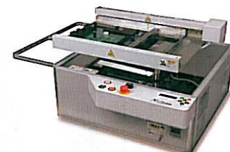
■ 「こてロボット」の作業・効率性を遥かに越えた「はんだ付けロボット」。

大手半田付産業機械メーカー(株)弘輝テックと業務提携し、生産効率や生産管理機能の強化を図りながら下請け企業を脱却、産業用機械メーカーを目指しています。応援コーディネーターや専門家から支援を受けながら、経営課題の洗い出しや事業計画作成を行いました。計画作成には私だけでなく後継者も参加させたことで、これまで以上にお互いの『考え』『意思』の疎通が図れました。これからは半田付産業機械メーカーとして革新してまいります。 ＜経営革新承認年月 平成 20 年 7 月＞