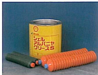
■ 取扱商品は4,000種類。ジャバラ式グリース1本からでも対応可。

潤滑油の多品種少量販売で福島県経営革新計画承認を受けました。ジャバラ式カートリッジなど何処にもない商品開発に力を注ぎ“グリースで日本一”を目指しています。経営革新事業を通じて、将来の目標設定や具体的なWEB販売手法について支援頂き、結果、新規お取引企業が年間100社増えました。厳しい経営環境が続くと思いますが、これからも『経営革新』『仲間づくり』を続けていきます。地元商工会と『地域力連携拠点』に感謝。 ＜経営革新承認年月 平成 19 年 8 月＞