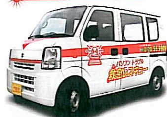
■ どこよりも速く、安く、確実に!! 福島県内全域にサービス展開中。